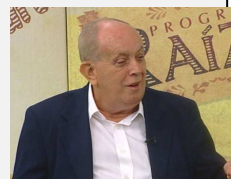
(TELES, Gilberto Mendonça (Org.). Os melhores contos de Bernardo Élis)

Prinspiava a seca, naquele final de março, com uns trovões assim como que disparados ali pelas três horas da tarde reboando nas bocainas. [...] Nos currais, os bezerros berravam vez por outra e algumas vacas mugiam a-mó-que engasgadas. [...] Ao sair da lua havia tão-só algumas raras nuvens arredondadas na barra do nascente, trocando entre si aquelas lambadas de coriscos, sem estrondo nenhum de ribombo de trovoadas. Era uma guerra de silêncio. – É a seca esse menino – dizia pra ninguém e para todos o Zeca-vaqueiro caçando seu jeito de sentar ali na calçada da frente da fazenda naquela sonoite inda com os relâmpagos retremendo o céu rabiscado do vôo cambaleante dos morceguinhos, ao tempo que em derredor se postavam os demais trabalhadores. Hoje ali tinha mais gente, como era de conforme se reunir quando o patrão aportava. A animação, a-mó-que ensurdecia o gemer do gado por perto, sem descontar os bezerros.