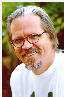
BEHR, Nicolas. Restos vitais.

As escolhas lexicais subvertem uma característica típica do gênero "receita" em favor da composição do poema de Nicolas Behr. Que característica é essa?