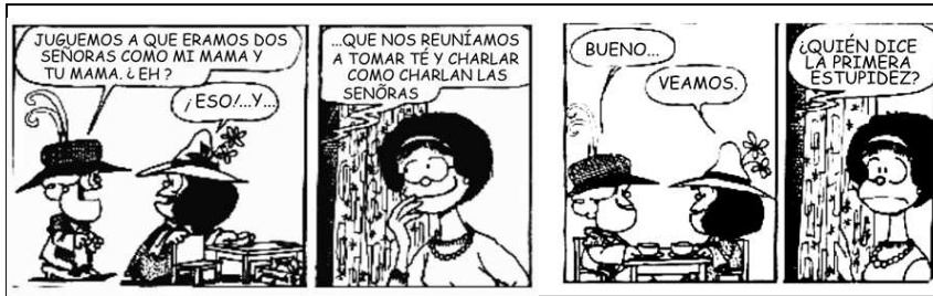
Tirinhas da Mafalda.

www.todohistorietas.com.ar/tiras2.htm . Acesso em 29/04/11