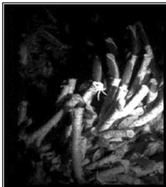
Tubícolas vermelhos (anelídeos gigantes)

Quanto aos seres mencionados no texto, é correto afirmar, exceto: